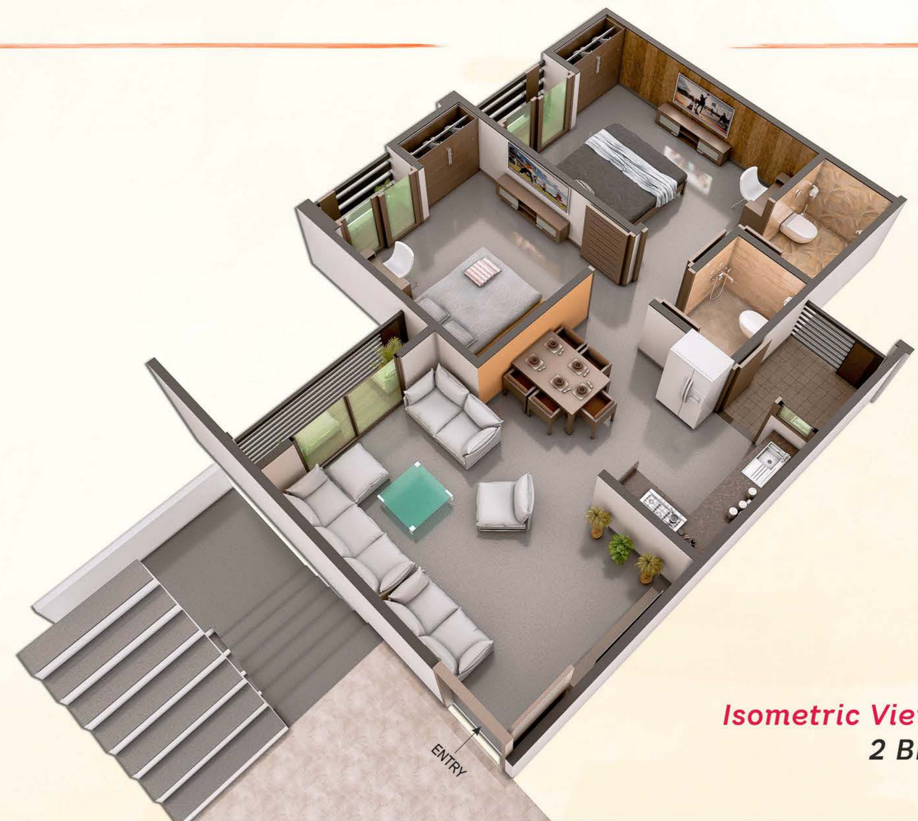
Isometric View 2 BHK Flat