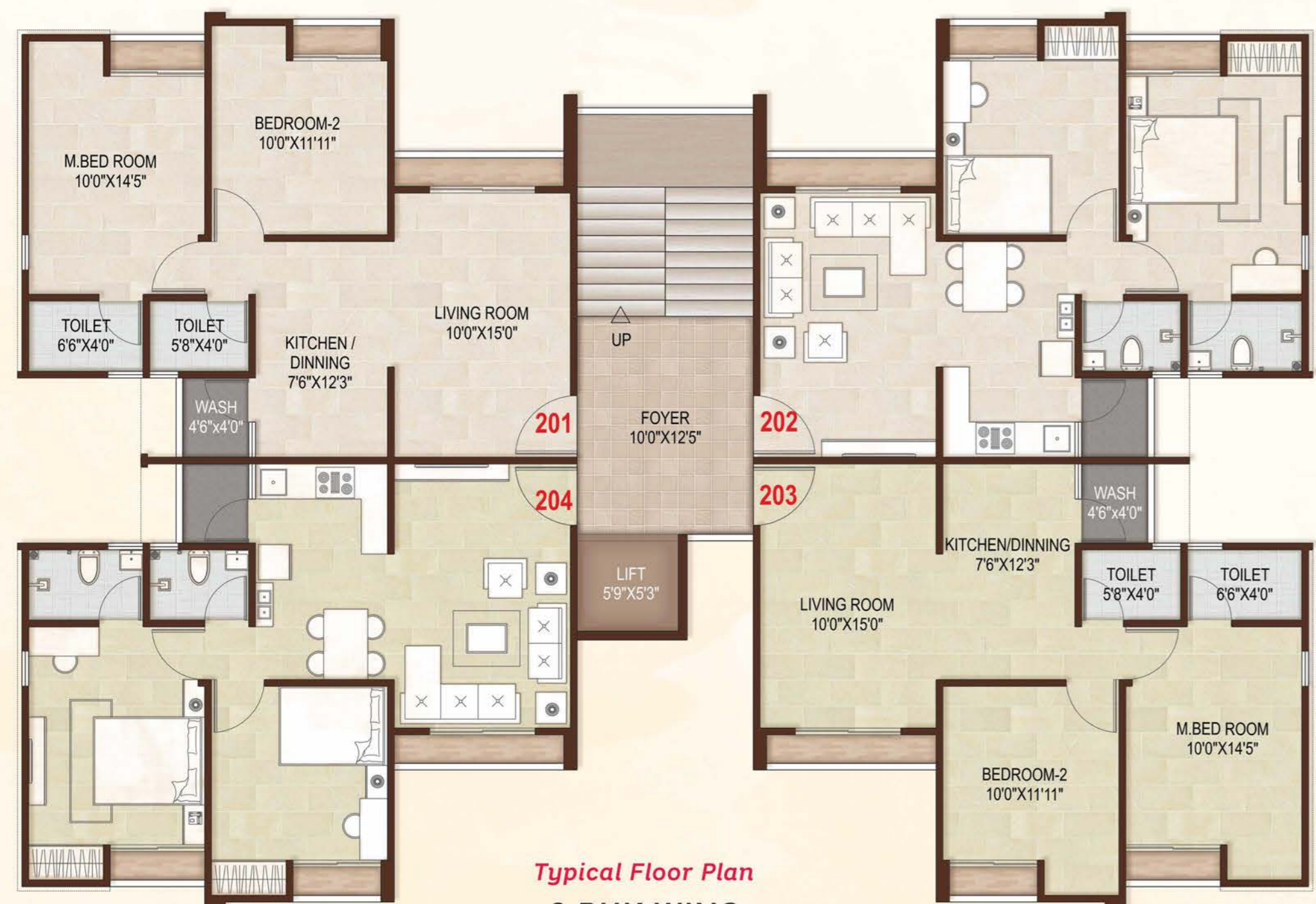
Typical Floor Plan 2 BHK WING WING No : A to C & G to O

ସୁକିର୍ତ୍ତନ Flora ...an aroma of your dreams