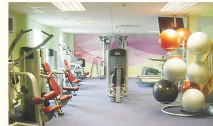
Well Equipped Gymnasium