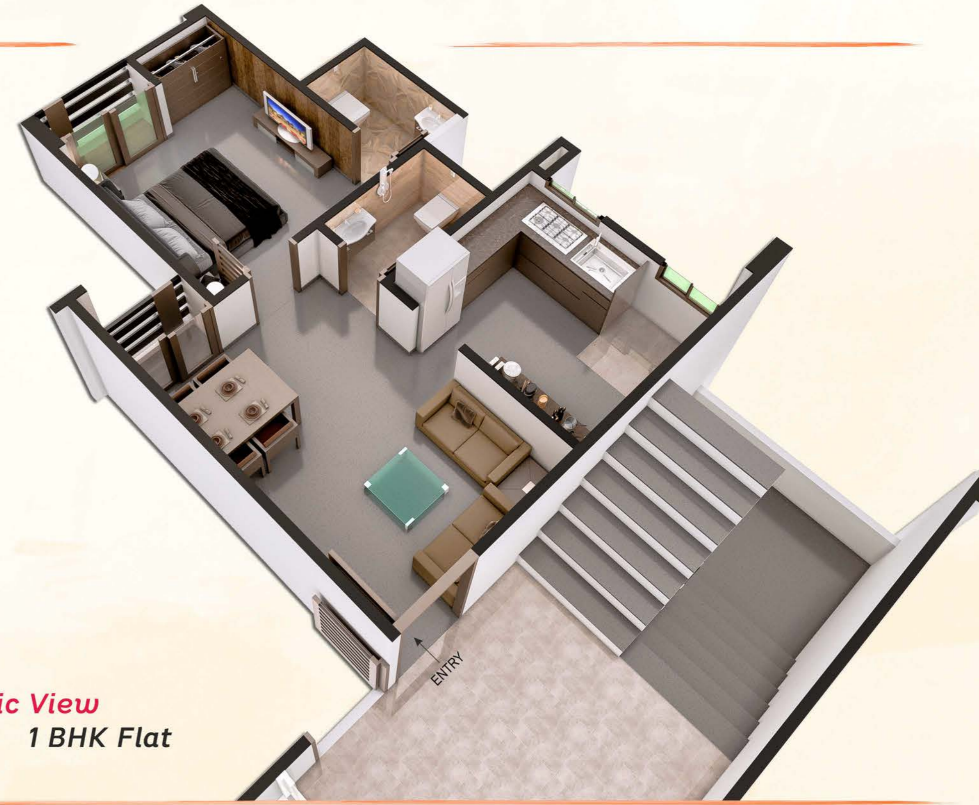
Isometric View 1 BHK Flat