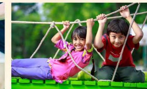
Children Play Area