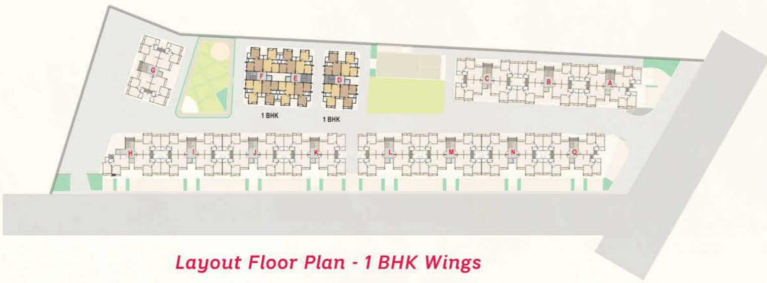
Layout Floor Plan - 1 BHK Wings