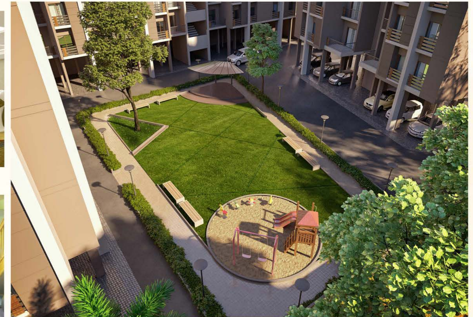
Landscaped Garden with Kid's Play Area