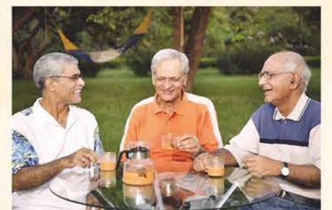
Senior Citizen Sit-outs