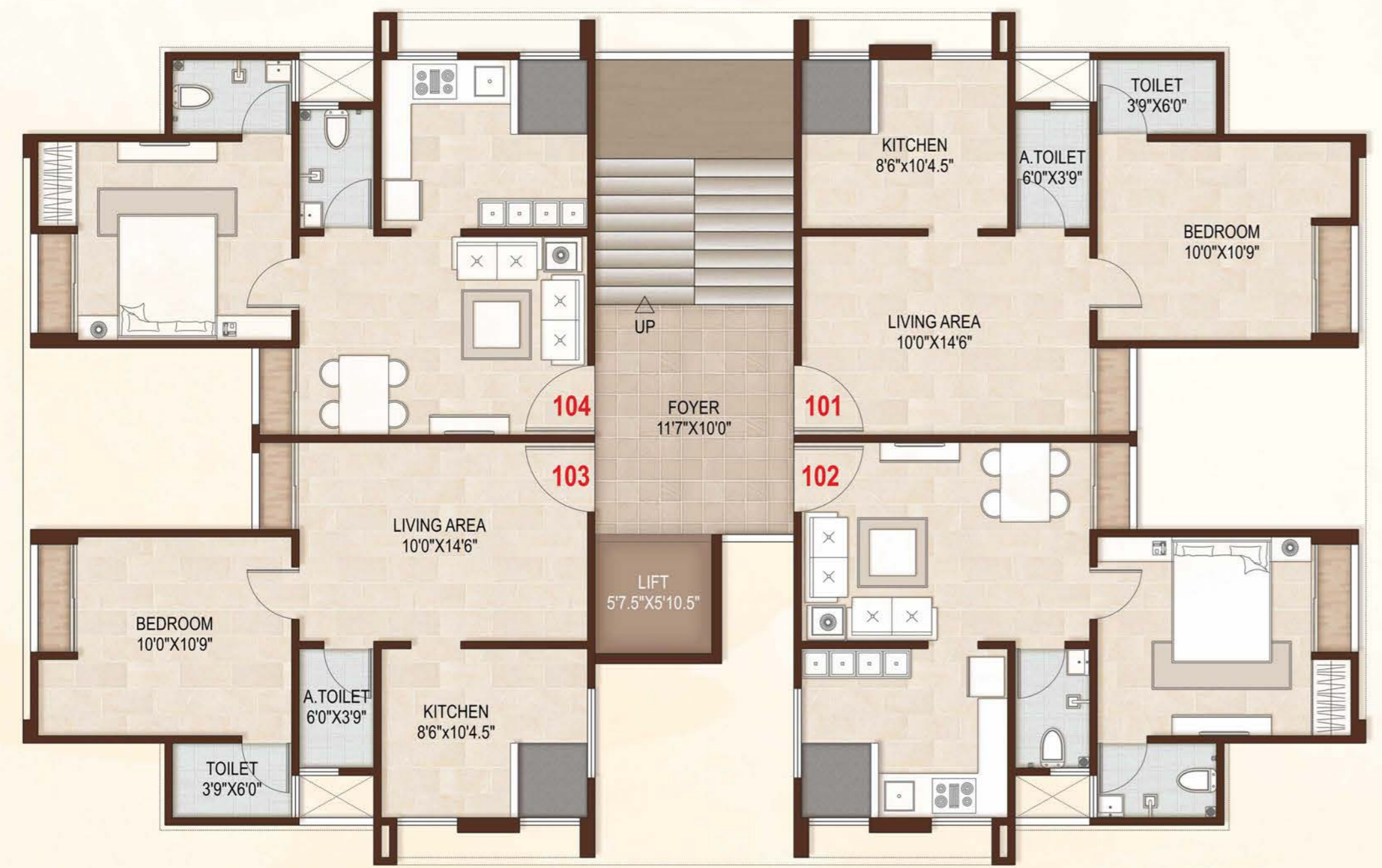
Typical Floor Plan 1 BHK WING - No : D, E & F